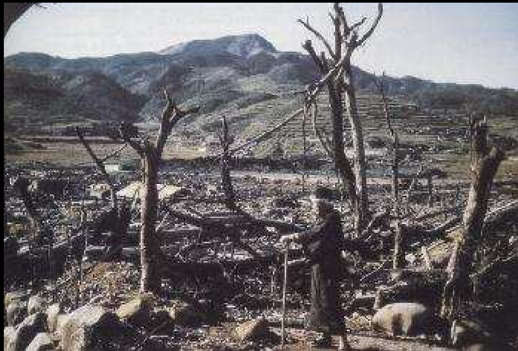
Nagasaki dopo l'olocausto nucleare