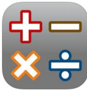
AB Math expert