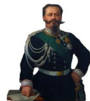
Vittorio Emanuele II

17 marzo 1848 Repubblica di Venezia scaccia gli austriaci